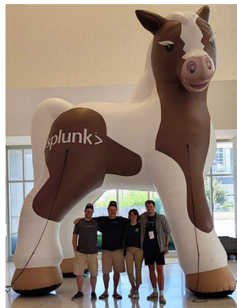
und 2024 vor Splunk Pony