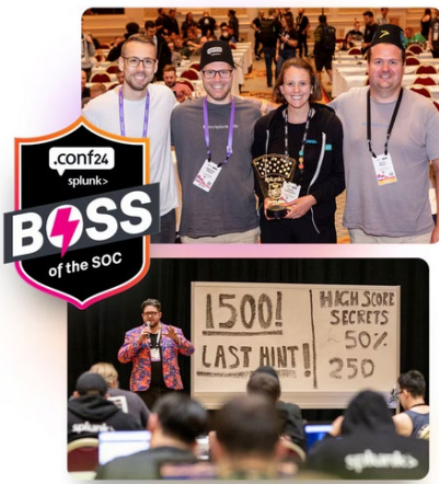
Das Consist-Gewinner-Team aus 2023 auf der BOTS24-Site