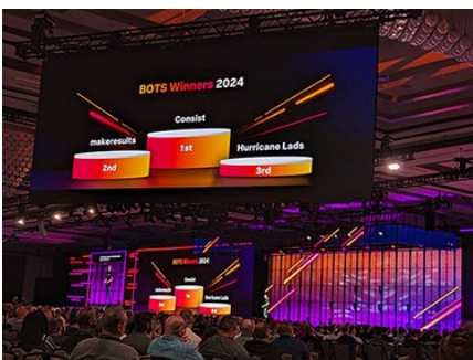
Consist gewinnt mit großem Punktevorsprung

Consist Software Solutions GmbH A Consist World Group Company